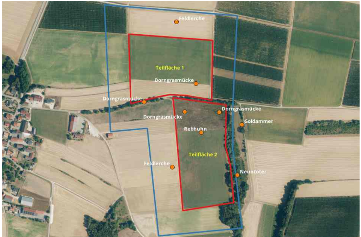
Abbildung 4: Festgestellte Brutreviere (relevant ist nur Teilfläche 1)

Es wurden auf der betreffenden Fläche (in der saP Teilfläche 1) Feldlerche und Dorngrasmücke festgestellt.