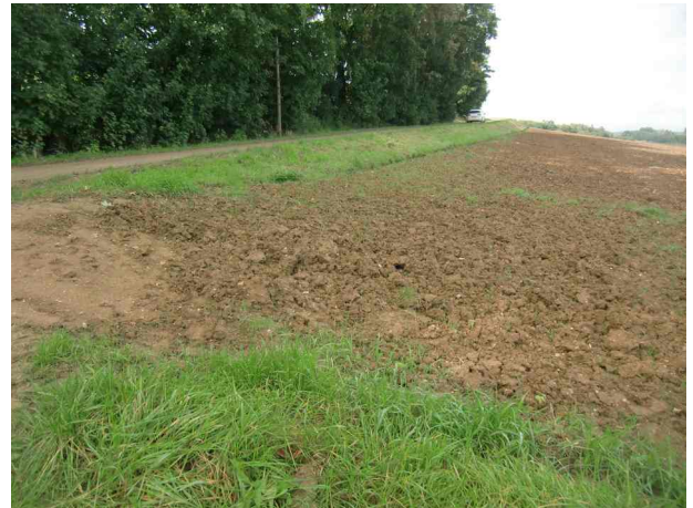
Abbildung 3: Blick über den südlichen Teil des Geltungsbereiches in Richtung Westen

Zum Vorkommen bodenbrütender Vogelarten wurden Erhebungen durchgeführt und in einer artenschutzfachlichen Beurteilung abgehandelt. Es wurde nördlich der geplanten Anlage ein Brutrevier der Feldlerche innerhalb des Wirkraumes der Anlage nachgewiesen. Eine CEF-Maßnahme ist daher erforderlich.