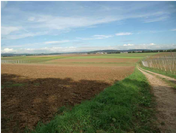
Abbildung 2: Anlagenfläche (links) mit Blick in Richtung Norden (Ortsrand Mindelstetten)

Der Vorhabensbereich wird derzeit als Acker genutzt. Er wird durch eine Straße im Süden und mehrere Flurwege im Norden, Osten und Westen erschlossen. Das Umfeld wird geprägt durch ackerbauliche Nutzung. Südlich des Geltungsbereiches wird die gegenüberliegende Wegseite durch einen linearen Gehölzbestand gesäumt. Der Geltungsbereich weist ein geringes Gefälle nach Norden auf.