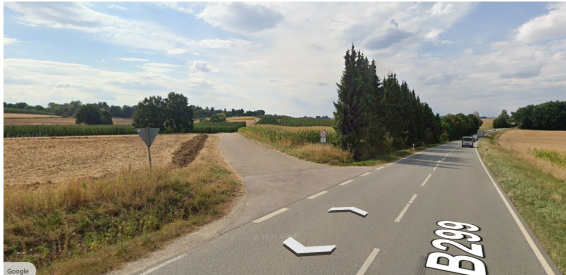
Abbildung 2: Blick von der B299 Richtung der Planfläche Hiendorf 1 (Street View)

Wie eine Analyse mit Google Earth zeigt ist die Sicht von der B299 auf die Anlage Hiendorf 3 aufgrund der Topologie nicht möglich, siehe Abbildung 3. Weiterhin verhindert eine Allee an der Ostgrenze der Fläche eine Sicht von der Fläche Hiendorf 3 Richtung B299.